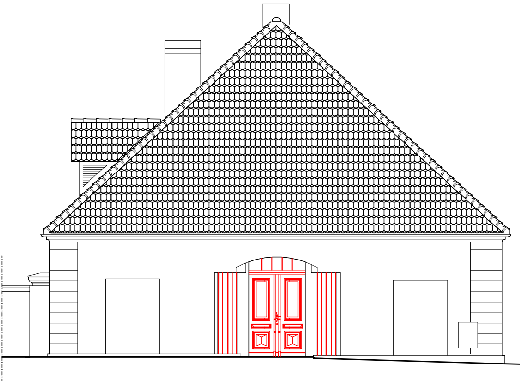
Elewacja zachodnia, skala 1:100